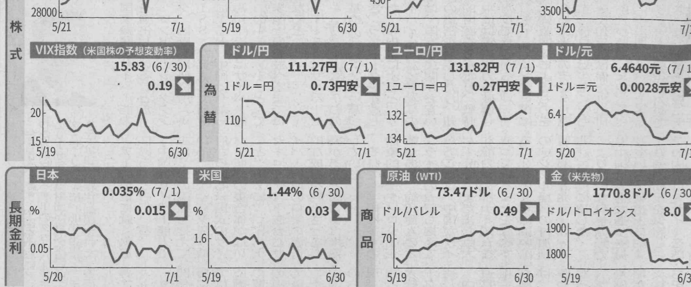
(注)直近終値(欧州株は日本時間18時時点の値)と前営業日終値比の騰落幅。長期金利は10年国債利回り

も利上げ 造を手がける仏アルスト ムが7%安など業種に売 秋ごろ りが波及している。 好調なのが海運で台湾 株を中心 の長栄海運の2倍超だ。 堅く推移 外債1カ月ぶり 国内熱売り越し 1兆円超 財務省が1日発表した 対外証券投資によると、 日本の投資家は6月20 26日の週に国債を中心と する海外中長期債を1兆 265億円売り越した。 265億円売り越した。 売れ越した。約1カ月ぶ り。米国の長期金利が低 り(債券価格は上昇)し 運株も上 下(債券価格は上昇)し 車両の製 たことで、利益確定売り 約1カ月ぶり。